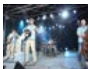
Baie du Cotentin (6)